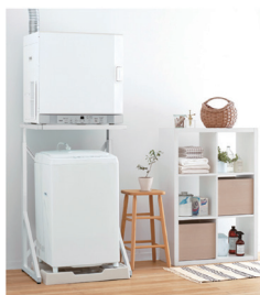
リンナイ ガス衣類乾燥機 乾太くん