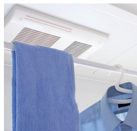
リクシル 浴室乾燥機

4月中旬にユードイプチマルシェ vol.2 を開催します! 詳細は次号でお知らせします。