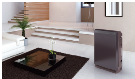
ダイキン 空気清浄機 ストリーマ